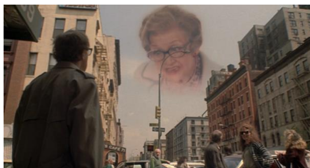
Figura 7: Sheldon descubre a su madre en el cielo

Para lo fantástico también he tomado como referencia la película New York Stories (1989), específicamente el fragmento dirigido por Woody Allen titulado Oedipus Wrecks , en el que la madre del protagonista Sheldon desaparece por arte de magia y luego vuelve a aparecer en el cielo, atormentando a su hijo por la decisión de casarse con una mujer no judía que ella desaprueba. Esta película me interesó a nivel de las interacciones del protagonista con su madre judía sobreprotectora y entrometida. También porque es una historia similar a la que se quiere contar en El fantasma de mi vieja donde una madre judía se involucra de manera fantástica e imposible en la vida de su hijo.