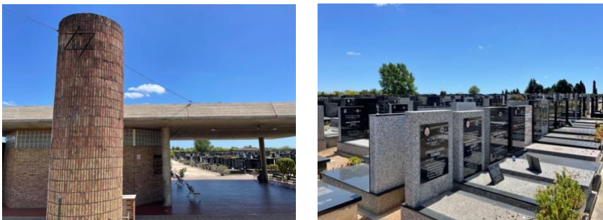
Figuras 8 y 9: Cementerio judío de La Paz

Por eso, al momento de escribir sobre lo que sucedía allí, se me dificultaba poder visualizar a los personajes y qué harían sin nunca haber ido, las cosas que se me ocurrían eran generales ya que, a la hora de escribir sobre ellos en el cementerio, la imagen que tenía era ambigua y se asemejaba a aquellos cementerios que se ven en las películas.