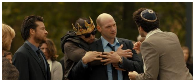
Figura 4: Los hermanos Altman