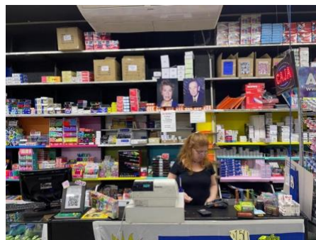
Figura 12: Papelería en Arenal Grande

Cuando visité, tuve la oportunidad de observar un negocio en específico, una papelería de la cual los dueños son judíos. Pude dialogar con ellos, sus hijos que estaban trabajando allí también y los empleados ajenos a la familia. Esto fue útil para poder tener una visión global del lugar en el que trabajaban. Esta tienda visitada fue la inspiración para la creación de “El Porteño”, la tienda de los Steinfeld, principalmente en lo estético, ya que era un negocio fundado por generaciones pasadas que sigue manteniéndose en pie por las nuevas generaciones que toman el mando.