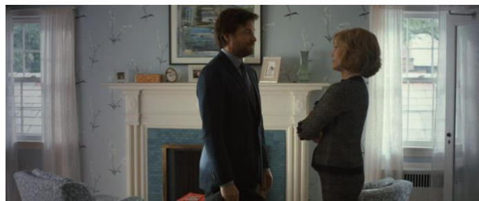
Figura 3: Judd Altman junto a su madre