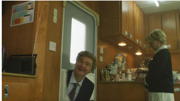
Figura 6: Fantasma atravesando una puerta sin que mujer lo vea

Esto fue lo que lo que a mí me interesó generar con la dinámica entre Myriam y Ruthy a lo largo de El fantasma de mi vieja . Además, me resultó atractivo a nivel de cómo operan los fantasmas en sí, cómo habitan dentro del mundo de los vivos, cómo interactúan con las personas que no los ven y con sus alrededores en general.